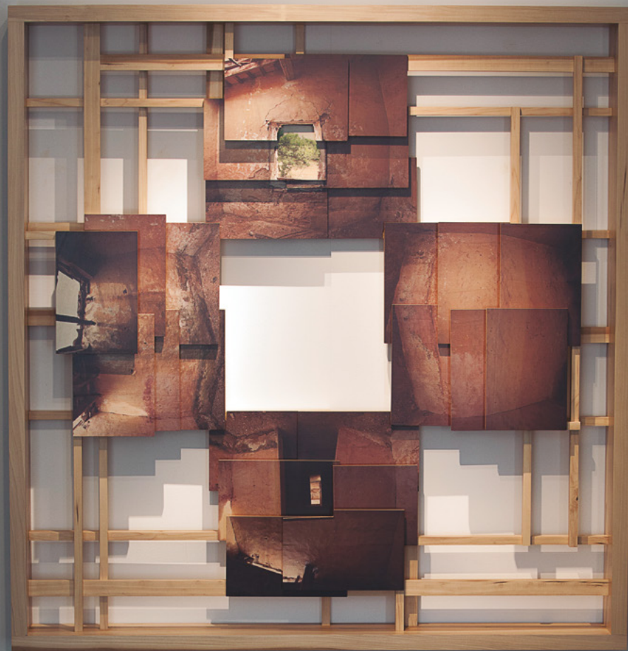
Dimensions: 158 x 152 x 20 cm Tècnica: fotografia UV sobre contraxapat i estructura de fusta Any: 2012