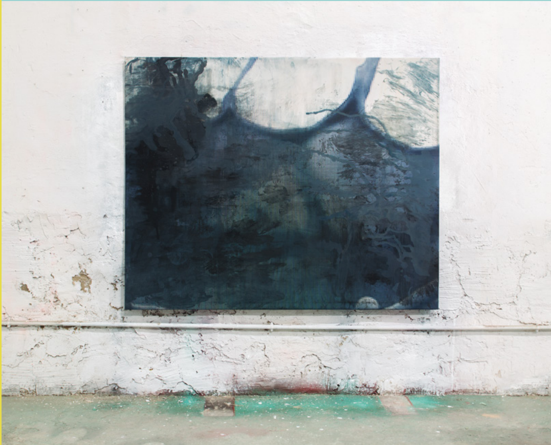
Dimensions: 130 x 162 cm Tècnica: esprai, dissolvent i fotografia digital sobre lona Any: 2019