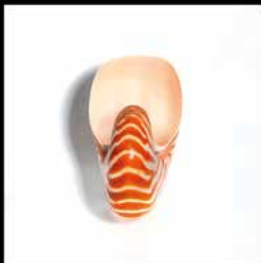
Nautilus pompilius (Vista ventral)