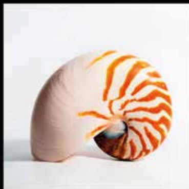
Nautilus pompilius (Vista dorsal)